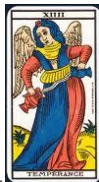
La Tempérance –

Elle représente un squelette, elle invite ou oblige au dépouillement, faire table rase du passé et rebondir. C'est une grande remise en question.