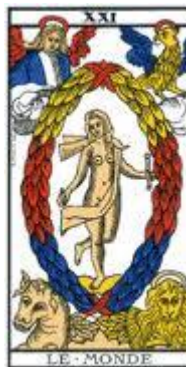
Le Monde –

A ce stade, l'être est en capacité de faire son auto-bilan, c'est le moment de faire le point sur sa vie.