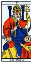
Le Pape –

C'est le Roi, le Président, le protecteur du peuple, le chef de guerre, il est casqué et inspire stabilité, dignité et bon sens. Il invite au respect. C'est une période de notre vie où nous prenons nos responsabilités.