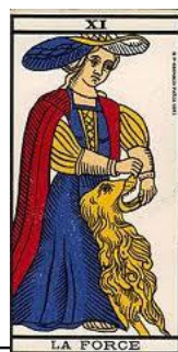
La Force –

Le temps passe, la roue tourne, les premiers sont les derniers, et les derniers accèdent au sommet, rien n'est figé. Cette roue possède une manivelle, qui de nous la prendra en main ? Nous restons maîtres de notre destin, avec un libre arbitre, osons actionner la manivelle de notre VIE.