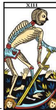
L'Arcane sans nom –

C'est un temps d'arrêt, de pause, voulu ou pas mais salutaire et indispensable. Il semble impuissant devant la situation, mais l'est-il vraiment ?