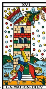
La Maison Dieu –

Lucifer sur son podium, imite et singe le Pape. Il porte des ailes de chauve-souris, c'est l'ange déchu avec des sabots d'animal, au bas du socle, deux petits diabolotins semblent sous son influence, sous emprise, alors que si l'on regarde bien, ils ne sont pas attachés au diable mais à un socle, ils peuvent s'échapper s'ils le veulent. Cette lame met l'accent sur nos excès, nos dépendances, nos vices. A quoi s'accroche-t-on ?