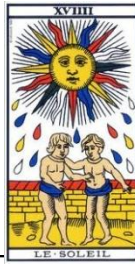
Le Soleil –

Elle luit la nuit. C'est par le soleil qu'elle brille. La nuit déforme notre vision, et nous devons être vigilant quant à la l'interprétation de ce que l'on voit. La nuit tous les chats sont gris. Elle nous parle du rêve, de l'imagination, de générosité et d'adaptabilité, mais aussi d'illusion, de période incertaine voire, de confusion. Cette lame concerne la féminité et la sensibilité, elle développe l'intuition et aide aux rapports avec autrui.