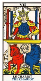
Le Chariot –

Au passage de cette lame, nous nous trouvons devant un dilemme, un choix souvent difficile à faire. Le choix de la facilité ou du courage ? Du vice ou de la vertu ? De ce choix, la suite du destin en découlera.