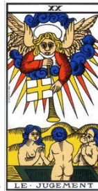
Le Jugement –

Il rayonne, il est généreux, il donne sans espoir de recevoir. Il incarne l'amour. Les deux êtres qui sont sous ses rayons donne le sentiment d'une approche intime. Il apporte la paix et les associations heureuse. A ce stade le Bateleur rayonne naturellement.